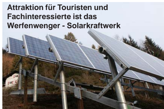
Attraktion für Touristen und Fachinteressierte ist das Werfenwenger - Solarkraftwerk