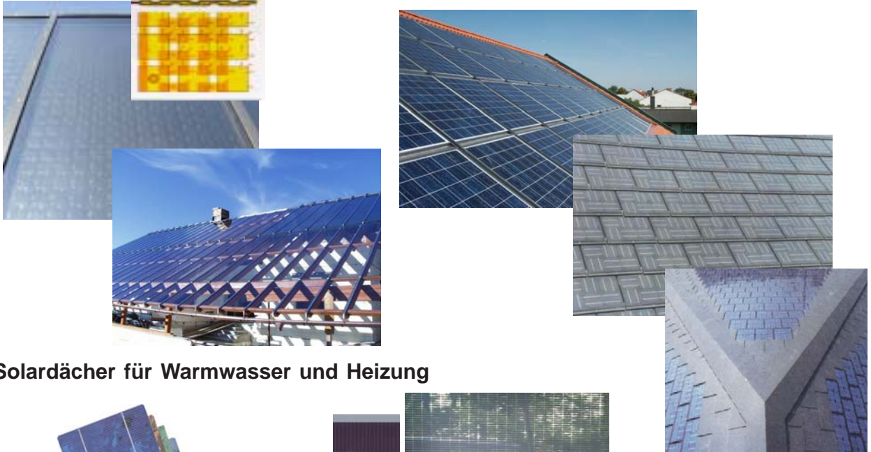
Solardächer für Warmwasser und Heizung

(100%-ige Energieversorgung mit Strom und Wärme aus nachwachsenden Rohstoffen und aus der Sonne)