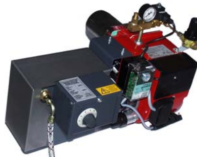
Strom und Wärme mit